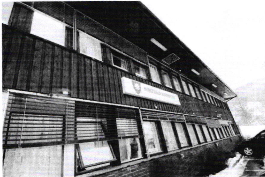
VARSLER: En ansatt ved legekontoret i Sørfold er nå blitt flyttet over til hjemmesykepleier. Selv mener hun dette er straff fordi hun har vært varsler.